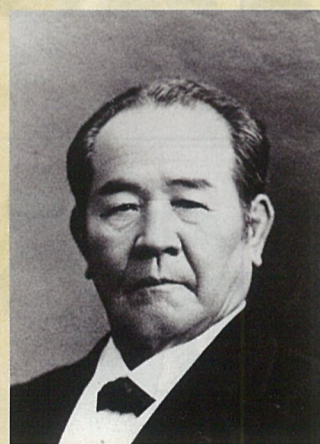
肖像画：埼玉県深谷市所蔵

渋沢栄一は、明治～昭和初期にかけて活躍した実業家です。生涯で約500もの企業の設立に関わり、「近代日本経済の父」と称されています。